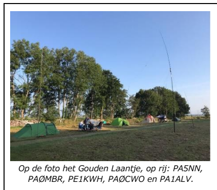
Op de foto het Gouden Laantje, op rij: PA5NN, PA0MBR, PE1KWH, PA0CWO en PA1ALV.

Het weekend van 4 en 5 september was het weer zover en mochten we ook dit jaar weer met een klein groepje komen kamperen bij 'iemand in zijn achtertuin'. Doel was het uitproberen van diverse antennes, QSO's maken met alleen QRP, veel onderling overleg, af en toe een biertje en op zaterdag avond een BBQ. De dagen voor het weekend gaf het weerbericht steeds beter weer aan en dat is gelukkig zo gebleven.