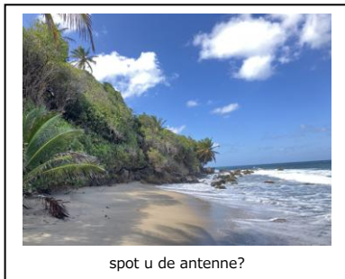
spot u de antenne?

Met twee laptops — één voor het PACC-log en één voor niet-Nederlandse stations — begon het meer op multitasking te lijken dan op ontspannen contesten. Daarom schakelde ik al snel over op Search & Pounce, wat rustiger werkte. Nadeel daarvan is natuurlijk dat Nederlandse stations die zelf geen "CQ" roepen niet in het log terechtkomen.